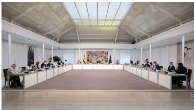
Celebración de un Consejo de Ministros

En estos momentos el deporte nacional tiene un problema importante que, a pesar de que no tiene una difícil solución, es algo que se lleva demorando durante meses, especialmente desde este verano. Fue el pasado 15 de junio cuando el Consejo de Ministros aprobó el proyecto de Ley Orgánica en la lucha contra el dopaje, el cual suponía realizar diferentes ajustes en la vigente Ley 3/2013.