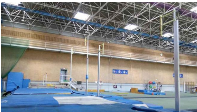
Centro de Alto Rendimiento de Madrid deportegob

La Agencia Mundial Antidopaje estableció una serie de cambios en su normativa global el pasado 1 de enero del 2021. Unas modificaciones que, evidentemente, afectaban a todos los países del mundo a quienes les obligaba a adaptar su legislación a este nuevo orden. Sin embargo, España sigue todavía anclada en el pasado sin haber podido aprobar su nueva normativa antidopaje.