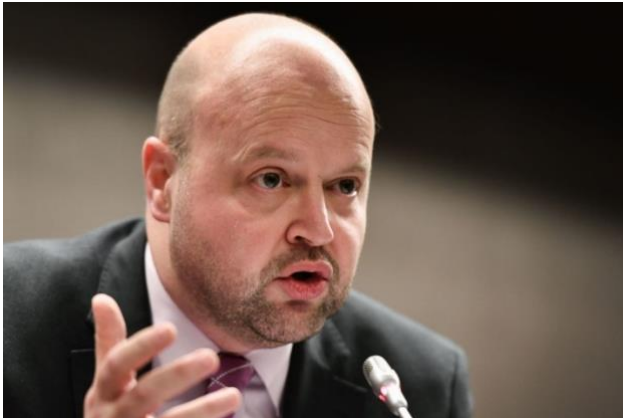
Sebastian Coe was talking to British lawyer

"Whether it's the International Olympic Committee, whether it's my own sport, even within Government there are micro-players out there that you have to be cognisant of and that you have to work with."