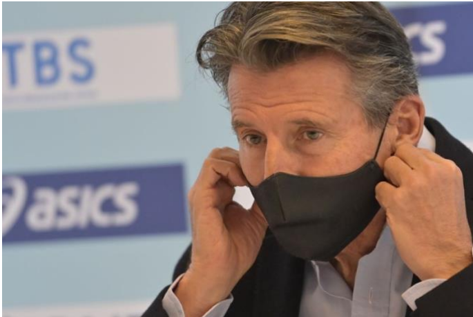
World Athletics President Sebastian

"I guess the proof of the pudding in all these organisations is 'would you be prepared to look at the nominally very top person in that organisation?'"