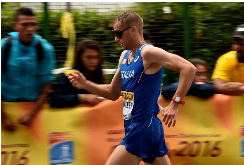
Schwazer en la Copa del Mundo de mayo de 2016 en la que consiguió el pase para los Juegos de Rio.

R. Me encantaría, sí, y espero poder ir. Estoy sancionado por algo que no he hecho. Tengo 36 años, me gustaría hacer alguna competición más; este año, el que viene. No está en mi mano y sé que es complicado.