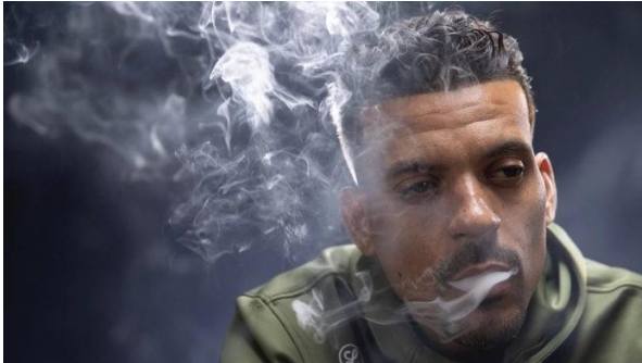
Matt Barnes, exjugador de la NBA, exhalando el humo mientras fuma.

NBA El asunto se tratará en la negociación del nuevo convenio colectivo