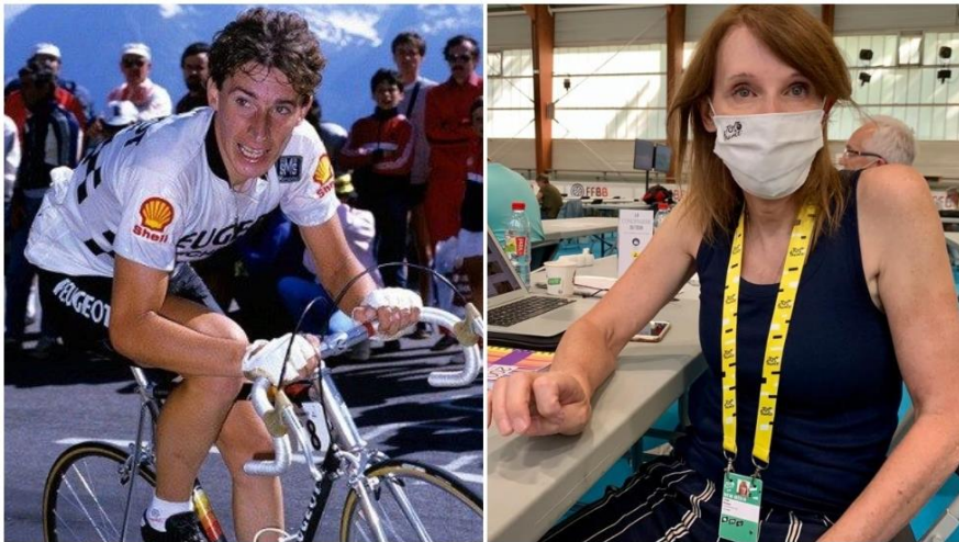
Robert Millar en su

época como ciclista y Philippa York posando ayer para MARCA