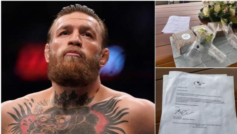
Connor McGregor muestra

UFC 2020 El irlandés se retiró en junio por tercera vez