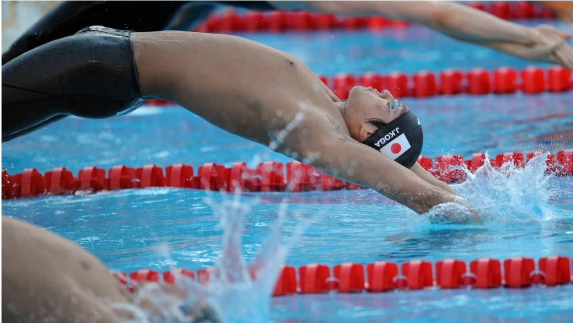
El nadador japonés, en un salida