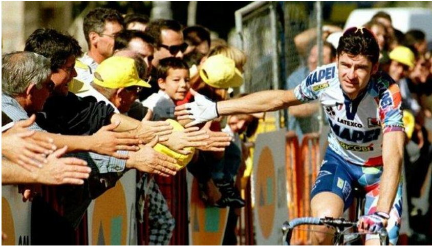
Bugno, el día de su

no te hace soñar, tío. O sea, tú sueñas con aquello que no sucede. Lo que le pedías a Bugno era eso: haznos soñar, haznos ilusionarnos. Y luego, ya si eso, te vendrá la pájara o la depresión. Tendrás un problema con tu mujer e irás al psicólogo. Lo que sea... pero haznos soñar. Haz que merezca la pena. Yo creo que esa es mi relación con la vida y con el deporte.