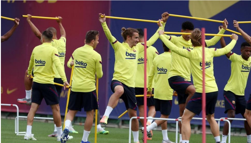
Entrenamiento del FC Barcelona del viernes 3 de julio de 2020 para preparar el duelo ante el Villarreal