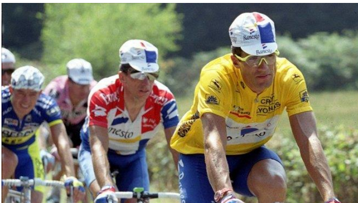
Indurain, en el Tour de 1995 |

Perico lo tenía todo, tío. Primero, era un escalador. O sea tu veías la etapa para ver cuando atacaba Perico. Luego tenía la dimensión internacional. En aquella época no había un Nadal ¡no había ni un Bruguera! No había ganadores de Giros ni de Tours. Por no haber, no había ni equipos campeones de Europa en el fútbol. Entonces veías el Tour, y que hubiera un español ahí, era la hostia. Y luego tenía el encanto de la imprevisibilidad. Porque Perico se pillaba unas pájaras descomunales o te metía demarraje y te sacaba en un kilómetro un minuto. Y eso engancha. Y luego ese carisma de gran comunicador, que siempre lo ha sido ¿Tú recuerdas una frase completa de Indurain? No existe.