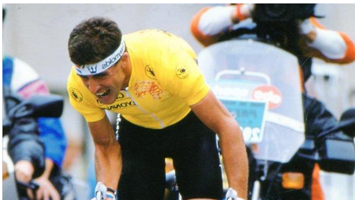
Perico Delgado, en el Tour de

[Risas]. Creo que, cada vez que a Fernando Savater le preguntan en qué época le hubiera gustado vivir, siempre contesta: 'En ninguna otra porque soy diabético'. Creo que probablemente la mayoría de recuerdos sean tramposos. Pero a mi todavía me cuesta mucho disfrutar del presente. Muchísimo. A veces pienso que soy un superviviente. Estoy tan pendiente de sobrevivir en el presente que no lo disfruto. Y cuando ya por fin lo ha sobrevivido miro hacia atrás y pienso: 'Uff, qué bien estuvo'. Y en el libro la nostalgia también juega un papel importante que me permite llenar espacios. Porque, cuando me encargaron este libro de ciclismo en los noventa, en lo primero que pensé fue en EPO. 'Vaya marrón', pensé. '¿Cómo hago esto sin acabar en un juzgado o apedreado en la calle y en el twitter?' Y ahí es cuando pensé: 'Mira, a tomar por el culo, el libro no va a ir sobre la realidad del ciclismo, el libro va a ir sobre mi nostalgia. Y en mi nostalgia no entra el doping porque yo no recuerdo el doping de esa época'.