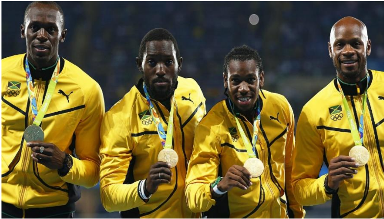
Usain Bolt, Nickel Ashmeade, Yohan Blake y Asafa Powell.

el jamaicano Johan Blake, al que muchos veían como el relevo natural de Usain Bolt y con una mejor marca de 9,69 en Lausana 2012 , admitió en 2009 haber consumido metilxantina antes de los campeonatos de su país.