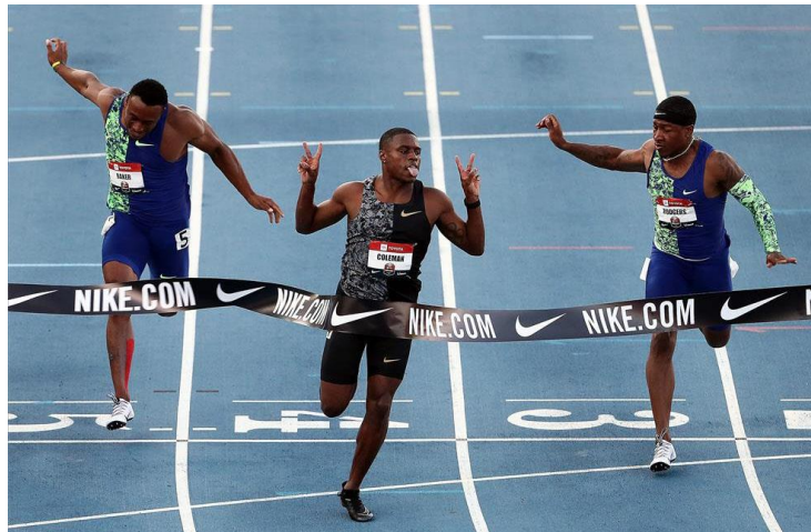
Chris Coleman, en una imagen de 2019

Bombazo el que hemos conocido esta misma mañana. El atleta estadounidense Christian Coleman ha sido suspendido provisionalmente este miércoles por la Unidad de Integridad del Atletismo por quebrantar las normas sobre la localización para los controles antidopaje, aunque el actual campeón del mundo de los 100 metros lisos asegura que estaba localizable para su último control.