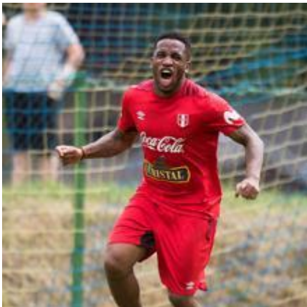
Farfán en un entrenamiento en Austria previo al partido de preparación para el Mundial de Rusia

15 años defendiendo los colores blanco y rojo. El capitán, ex jugador de Bayern de Munich y Hamburgo, es el máximo referente de Perú para este Mundial, y la esperanza de sus aficionados para alcanzar los octavos del campeonato.