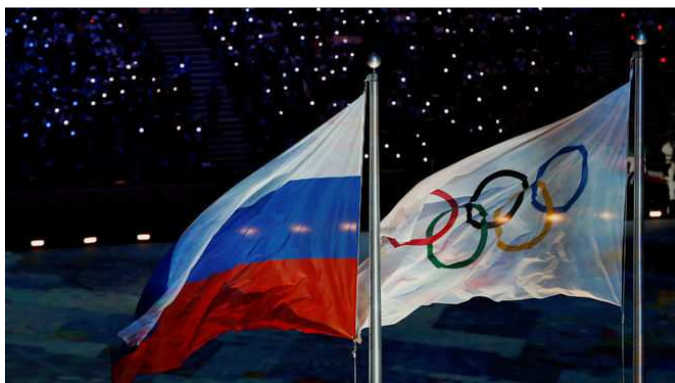
La bandera de Rusia y la olímpica, en Sochi.